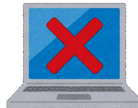
落として破損させた

上記のアクシデント（一例）はメーカー保証外のため、有償修理となり、ご自身で修理費用を負担して修理していただきます。