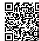
お問合せフォーム